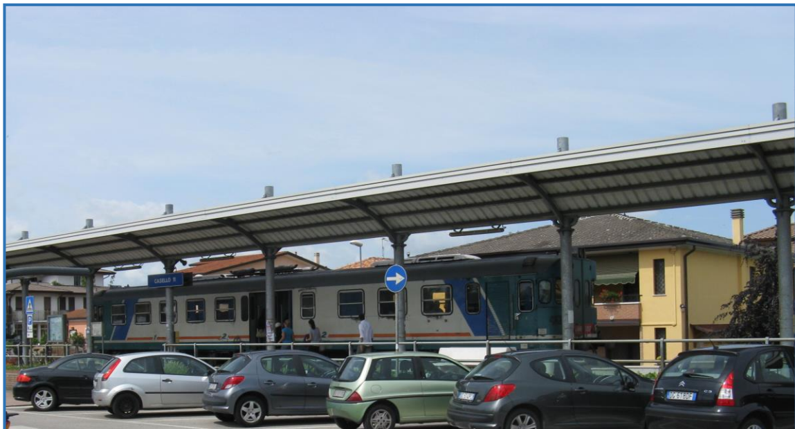
Fermata di Casello 11 (Calcroci di Camponogara)

(2) Possibilità di parcheggio libero di auto, moto e biciclette in prossimità della stazione o nelle immediate vicinanze (200/300 mt.)