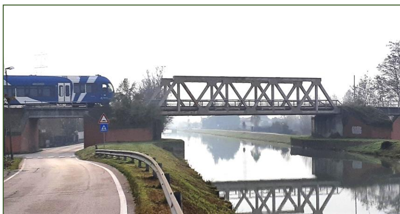
Comune di Mira – Ponte sul fiume Novissimo

Regolamento (UE) n. 1300/2014 _ 4.2. Specifiche funzionali e tecniche _ 4.2.1. Sottosistema infrastruttura